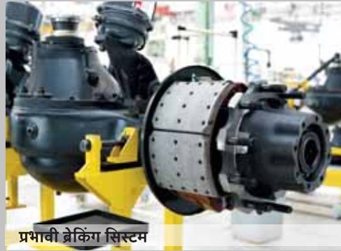
प्रभावी ब्रेकिंग सिस्टम