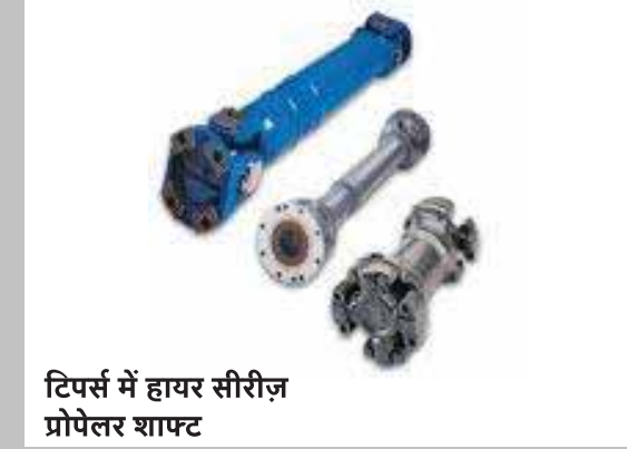
टिपर्स में हायर सीरीज़ प्रोपेलर शाफ्ट

चौड़ी जगह वाले ग्रिल, जिनसे हवा आसानी से अंदर आए और रेडिएटर को हर समय ठंडा रखे।