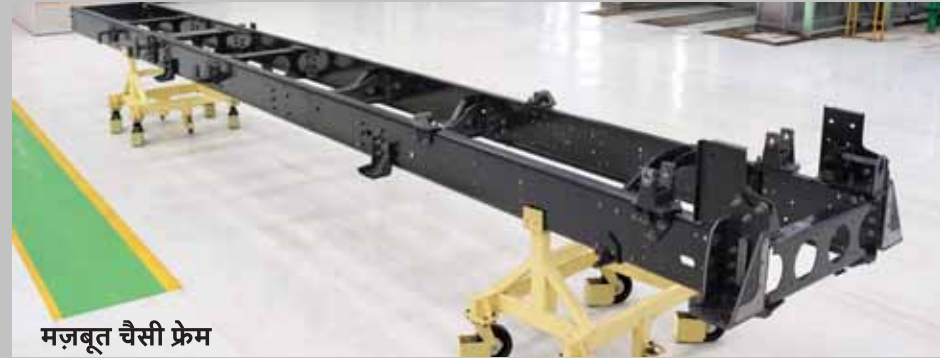
मज़बूत चैसी फ्रेम

हमने अपने ट्रकों को बनाते समय उन चीज़ों पर भी बड़ा सोच-विचार किया है, जिनके होने का पूर्वानुमान लगभग नहीं लगाया जा सकता है। इसीलिए इन ट्रकों में ऐसी अनेक खूबियाँ हैं, जिनसे लगातार दमदार प्रदर्शन मिलता है। जैसे कि टैग/पुशर लिफ्ट एक्सल जिससे टायरों में घिसावट कम से कम हो, चाहे लोड कैसा भी हो, चाहे सड़कें कैसी भी हों। इनके बोगी सस्पेंशन से आपको अलग-अलग तरह के लोड और इलाकों की परिस्थितियों के हिसाब से समायोजन करने में मदद मिलती है। इनमें है 395 mm का बड़ा क्लच, जिससे क्लच का बेहतर जीवनकाल सुनिश्चित होता है। इनमें है हैवी ड्यूटी ईटॉन/ZF गीयरबॉक्स 6s/9s, जिससे मिले बेहतर प्रदर्शन, सुरक्षा और सरल-सहज ड्राइविंग का अनुभव। चैसी, 10 बार प्रेशर वाले एस-कैम एयरब्रेक्स और रियर लीफ सस्पेंशन से यह वाहन बेहद मज़बूत और पहले ही दिन से एक भरोसेमंद चुनाव साबित होता है। इनमें लगाया गया है एक हैवी ड्यूटी फ्रंट एक्सल, जिससे ये सालों-साल बिना परेशानी चलते रहें। इन सभी चीज़ों की डिज़ाइन इस तरह से बनाई गई है, जिससे वे टिकाऊ रहें, लगातार बेहतरीन प्रदर्शन करती रहें और रखरखाव की ज़रूरत कम से कम पड़े।