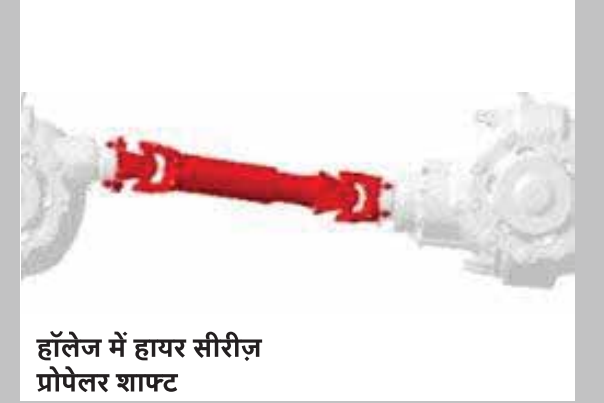
हॉलेज में हायर सीरीज़ प्रोपेलर शाफ्ट

इसमें 415 लीटर तक आसानी से आ जाए (महिंद्रा BLAZO X सीरीज़ में सबसे ज़्यादा क्षमता)। लंबी दूरी तक जाने के लिए बिलकुल सही।