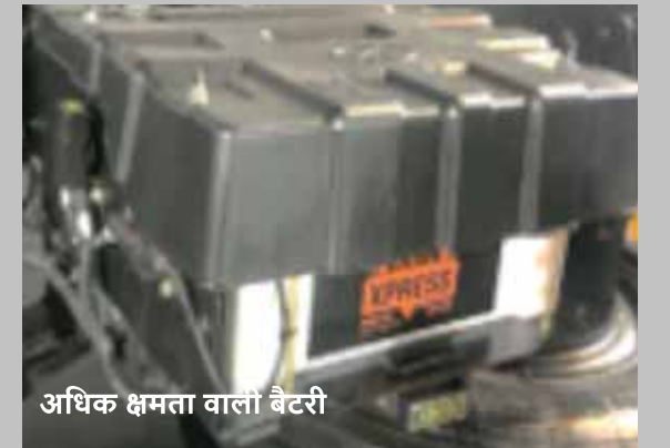
अधिक क्षमता वाली बैटरी

इसके उन्नत सेन्टर बियरिंग किट से 2000 सीरीज़ को कॉम्पैक्ट बनाने में मदद मिलती है और इससे धूल का प्रवेश नहीं होता है। प्रोपेलर शाफ्ट की लंबाई बढ़ने से ऊबड़-खाबड़ इलाकों में लचीलापन बेहतर होता है। इसमें बेहतर पॉवर ट्रांसमिशन हेतु 2055 सीरीज़ की उन्नत ड्राइव शाफ्ट है।