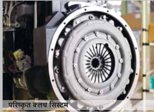
परिष्कृत क्लच सिस्टम