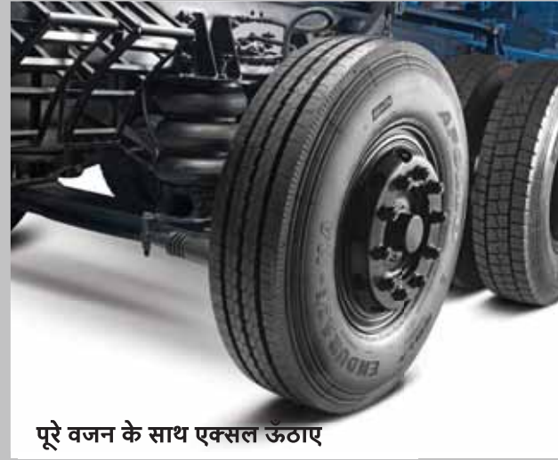
पूरे वजन के साथ एक्सल ऊँठाए

हमने अपने ट्रकों को बनाते समय उन चीज़ों पर भी बड़ा सोच-विचार किया है, जिनके होने का पूर्वानुमान लगभग नहीं लगाया जा सकता है। इसीलिए इन ट्रकों में ऐसी अनेक खूबियाँ हैं, जिनसे लगातार दमदार प्रदर्शन मिलता है। जैसे कि टैग/पुशर लिफ्ट एक्सल जिससे टायरों में घिसावट कम से कम हो, चाहे लोड कैसा भी हो, चाहे सड़कें कैसी भी हों। इनके बोगी सस्पेंशन से आपको अलग-अलग तरह के लोड और इलाकों की परिस्थितियों के हिसाब से समायोजन करने में मदद मिलती है। इनमें है 395 mm का बड़ा क्लच, जिससे क्लच का बेहतर जीवनकाल सुनिश्चित होता है। इनमें है हैवी ड्यूटी ईटॉन/ZF गीयरबॉक्स 6s/9s, जिससे मिले बेहतर प्रदर्शन, सुरक्षा और सरल-सहज ड्राइविंग का अनुभव। चैसी, 10 बार प्रेशर वाले एस-कैम एयरब्रेक्स और रियर लीफ सस्पेंशन से यह वाहन बेहद मज़बूत और पहले ही दिन से एक भरोसेमंद चुनाव साबित होता है। इनमें लगाया गया है एक हैवी ड्यूटी फ्रंट एक्सल, जिससे ये सालों-साल बिना परेशानी चलते रहें। इन सभी चीज़ों की डिज़ाइन इस तरह से बनाई गई है, जिससे वे टिकाऊ रहें, लगातार बेहतरीन प्रदर्शन करती रहें और रखरखाव की ज़रूरत कम से कम पड़े।