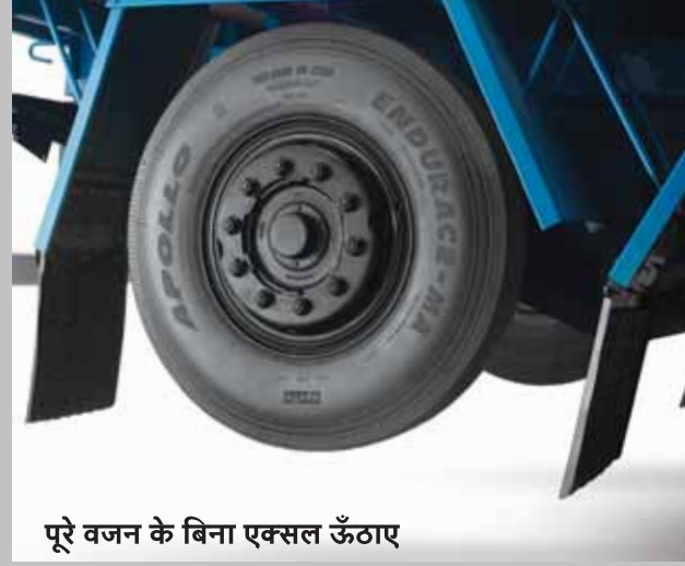
पूरे वजन के बिना एक्सल ऊँठाए