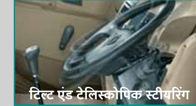
टिल्ट एंड टेलिस्कोपिक स्टीयरिंग

महिंद्रा BLAZO X भारत के सबसे आरामदायक ट्रकों में से एक है। इनका निर्माण इस बात को ध्यान में रखकर किया गया है कि ड्राइवर भारतीय परिवहन के असली पहिए हैं और वे अपना लगभग ज़्यादातर समय केबिन के अंदर बिताते हैं। इसीलिए इस ट्रक में ऐसी अनेक खूबियाँ हैं, जिससे हर ड्राइवर बनती है ज़्यादा सुरक्षित और ज़्यादा आरामदायक। जैसे कि इसका 4 पॉइंट सस्पेंडेड केबिन, जिससे इसकी ड्राइविंग बने सचमुच ज़्यादा आरामदायक। और इसके कंट्रॉल्स को भी इतना सोच-समझकर और ऐसी जगहों पर दिया गया है, जिनसे केबिन के भीतर कम से कम मेहनत लगे।