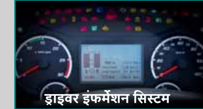
ड्राइवर इंफॉर्मेशन सिस्टम

इसका टिल्ट एंड टेलिस्कोपिक स्टीयरिंग ड्राइवर को अपनी सुविधा के अनुसार स्टीयरिंग एडजस्ट करने की सुविधा देता है। इसकी बड़ी विंडशील्ड और बड़े रियर व्यू मिरर से अच्छी विज़िबिलिटी मिलती है। और इसका एंटी-लॉक ब्रेकिंग सिस्टम ज़्यादा रफ़्तार में भी बेहतरीन ब्रेकिंग कंट्रोल सुनिश्चित करता है। दूसरे शब्दों में, यह एक ऐसा ट्रक है, जिसे सुरक्षित और थकान-रहित ड्राइविंग के लिए बनाया गया है, यानी इससे ड्राइवर कम स्टॉपिज लेते हैं, कम समय में ज़्यादा दूरी तय करते हैं और इससे बेहतर टर्नओवर समय मिलता है।