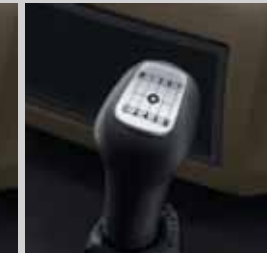
9-स्पीड गीयर शिफ्ट