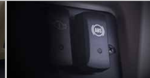
एंटी-लॉक ब्रेकिंग सिस्टम