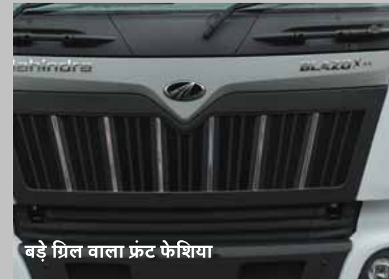
बड़े ग्रिल वाला फ्रंट फेशिया

इनसे मिले बेहतर फोकल लेंथ और विज़िबिलिटी और साथ ही इनका फिलामेंट ऊबड़-खाबड़ सड़कों पर भी पूरी तरह से सुरक्षित बना रहे।