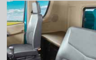
आरामदायक स्लीपर बर्थ