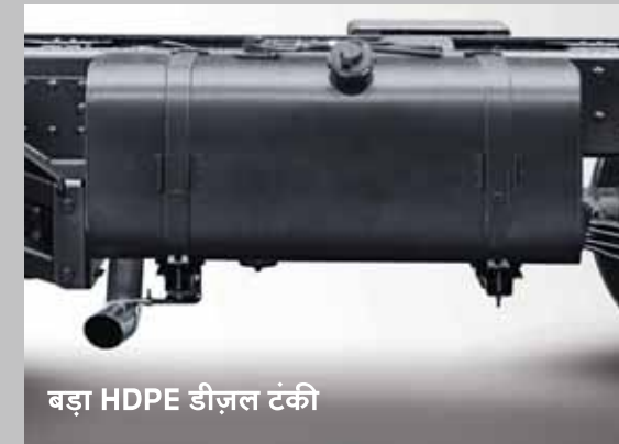
बड़ा HDPE डीज़ल टंकी

इसमें एक्सल चलाने के लिए बेहतर पॉवर ट्रांसमिशन हेतु 2055 सीरीज़ प्रोपेलर शाफ्ट का प्रयोग किया गया है। रियर एक्सल साइड एंड कनेक्शन को बढ़ाकर T180 किया गया है, जिससे कॉमन फ्लांज डायामेटर के कारण मॉड्यूलरिटी बनी रहे।