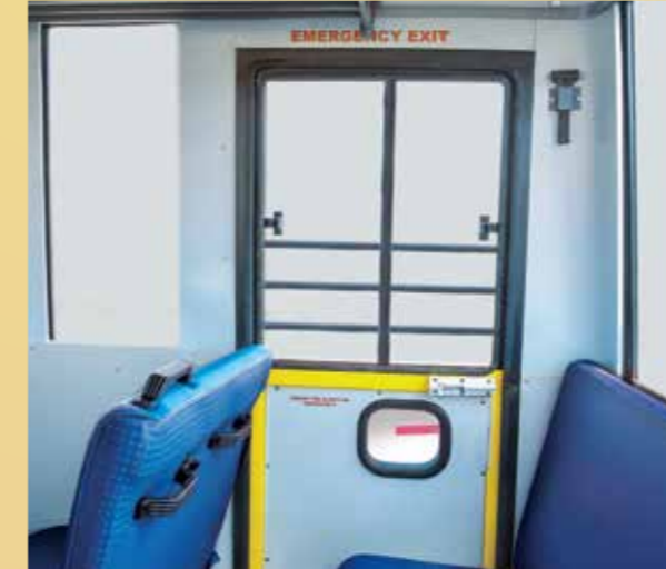
आपातकालीन स्थिति में तुरंत खाली करने के लिये इमरजेंसी एग्जिट