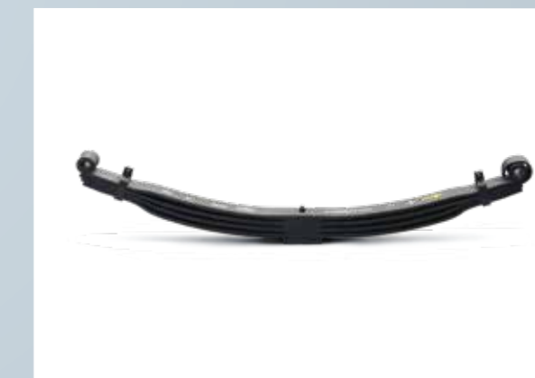
आरामदेह यात्रा और स्थिरता के लिये पैराबोलिक सस्पेंशन के साथ ऐंटी-रोल बार

कई प्रकार की खूबियाँ सुनिश्चित करती हैं कि यात्रियों को उनकी सीट्स पर ज़्यादा आराम मिले और वे अपने दफ़्तर पहुँचकर तरोताजा महसूस करें ।