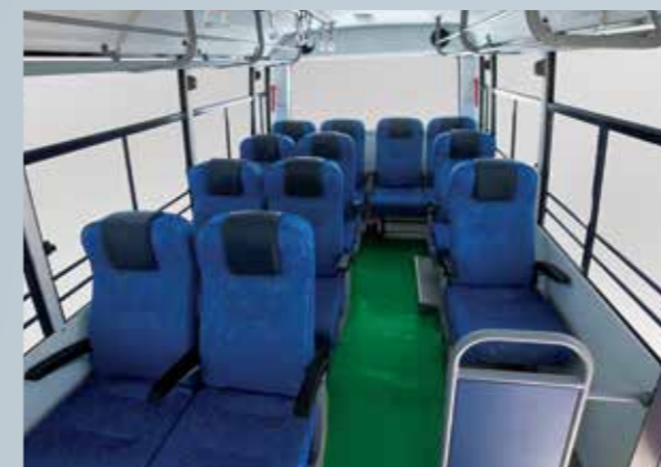
ज़्यादा चौड़ी सीट्स और चौड़ा गलियारा

महिंद्रा CRUZIO को ड्राइवर और यात्रियों के आराम को ध्यान में रखते हुए बनाया गया है ।