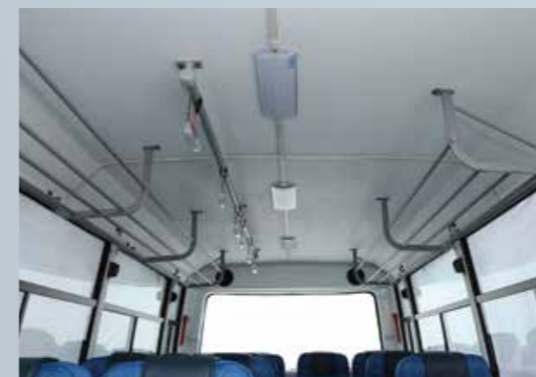
आरामदेह और ज़्यादा जगह देने वाले इंटीरियर्स