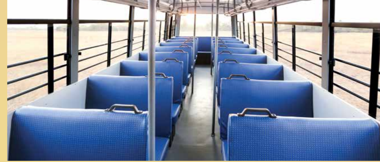
पूरे आराम के लिये डिज़ाइन की गयी सीट्स