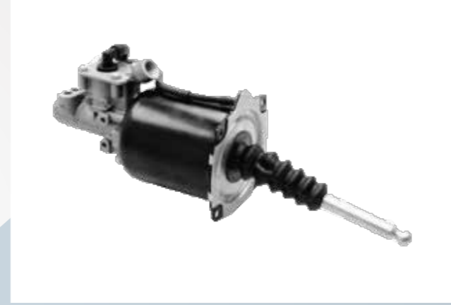
थकान के बिना गाड़ी चलाने के लिये क्लच बूस्टर के साथ हेवी ड्यूटी गियरबॉक्स और बड़ा क्लच