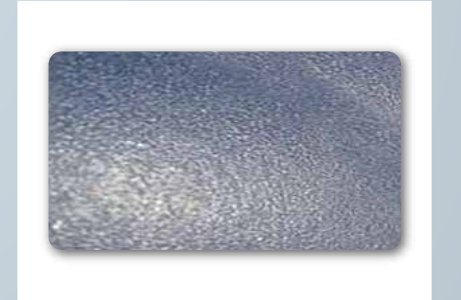
सिलिकॉन कार्बाइड पार्टिकल्स के साथ ऐंटी-स्किड विनाइल फ़्लोरिंग