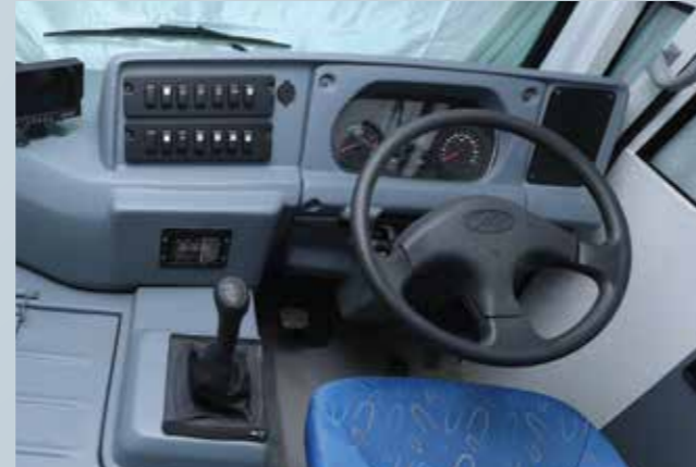
टिल्ट एंड टेलीस्कोपिक स्टीयरिंग