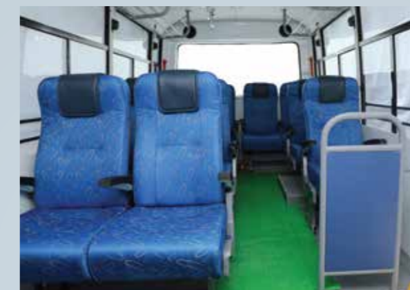
ज़्यादा बैठाने की क्षमता का मतलब है बस मालिक के लिये ज़्यादा मुनाफ़ा