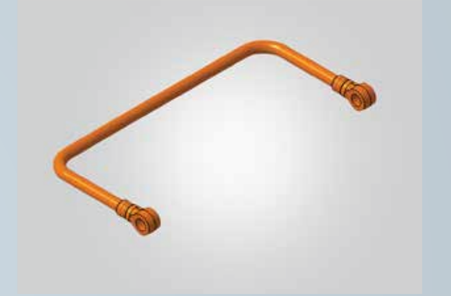
ज्यादा रफ़तार में स्थिरता के लिये ऐंटी-रोल बार