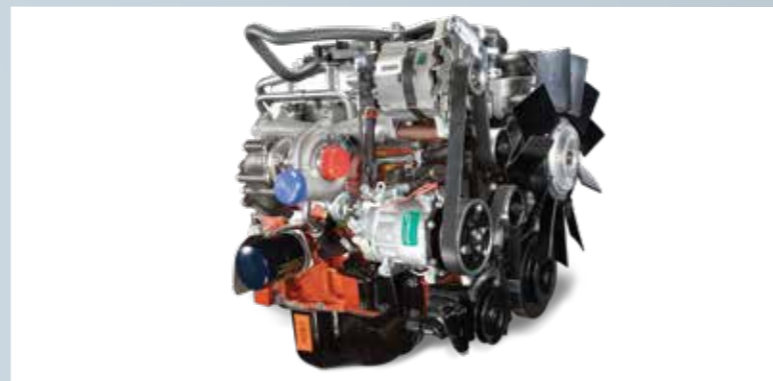
भरोसेमंद 2.5 लीटर mDi इंजन बेस्ट-इन-क्लास माइलेज के साथ

महिंद्रा CRUZIO में है भरोसेमंद mDi इंजन, जो पूरी तरह BS6 के अनुसार है और हर ट्रिप में ज़्यादा माइलेज देता है ।