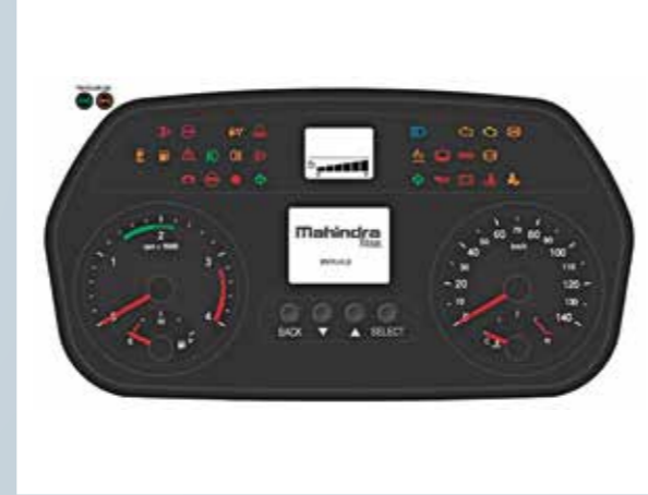
बेहतर ट्रिप मैनेजमेंट के लिये एडवांस्ड ड्राइवर मैनेजमेंट सिस्टम