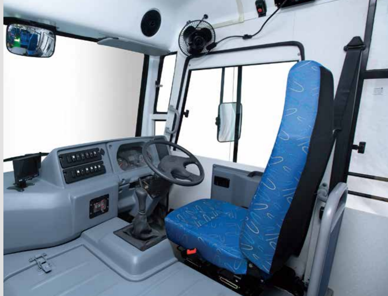
4-वे एडजस्टेबल ड्राइवर सीट, इनबिल्ट हेडरेस्ट, 3-पॉइंट इमरजेंसी लॉकिंग रीट्रैक्टर टाइप ड्राइवर सीट बेल्ट

निम्नलिखित नयी सुविधाएँ और फीचर्स सुनिश्चित करते हैं कि ड्राइवर गाड़ी चलाते समय हमेशा आराम महसूस करे ।