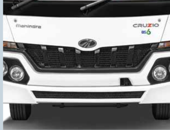
बेहतर सुविधा के लिये फ्रंट-ओपनेबल फ़्लैप