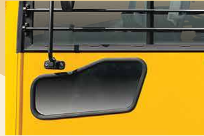
सह-चालक साइड में पीप विंडो

महिंद्रा CRUZIO स्कूल बस बच्चों की सुरक्षा को सबसे ज़्यादा महत्व देती है । इसमें कई ऐसी खूबियाँ हैं, जो स्कूल जाने और आने के सफ़र को ज़्यादा सुरक्षित बनाती हैं । जैसे वेहिकल ट्रैकिंग सिस्टम (VTS), फ़ायर डिटेक्शन एंड सप्रेसन सिस्टम (FDSS), चाइल्ड चेक-मेट फ़ीचर और महिंद्रा iMAXX, जिसका इस्तेमाल बस की ट्रैकिंग के लिये किया जाता है । इतना ही नहीं, इसमें आपको आरटीओ द्वारा सुझाये गये सभी सुरक्षा विशेषताएँ होने का आश्वासन भी मिलता है ।