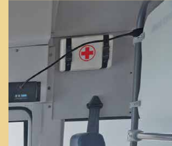
तुरंत प्राथमिक उपचार पाने के लिये फर्स्ट एड बॉक्स