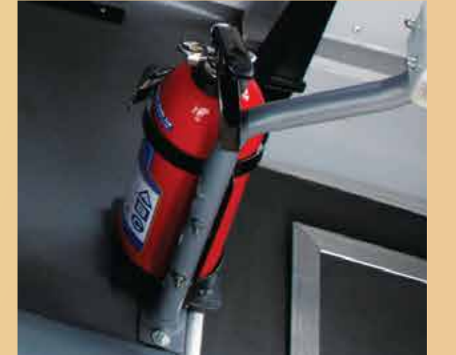
फ़ायर अग्नि शामक