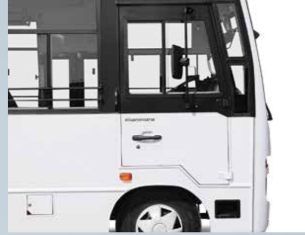
बाहर निकलने और अंदर आने के लिये चौड़ा डोर