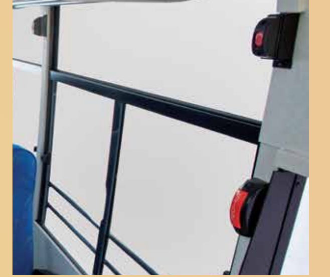
हर सीट सेक्शन पर इमरजेंसी बटन