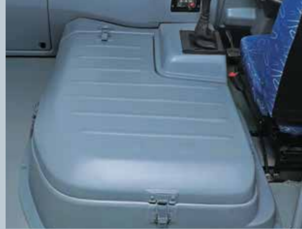
केबिन में ज़्यादा जगह के लिये एक कॉम्पैक्ट इंजन हुड

सोच समझ कर बनाये गये ये फ़ीचर्स सुनिश्चित करते हैं कि पूरे सफ़र में ड्राइवर ज़्यादा सुविधा का आनंद ले सके।