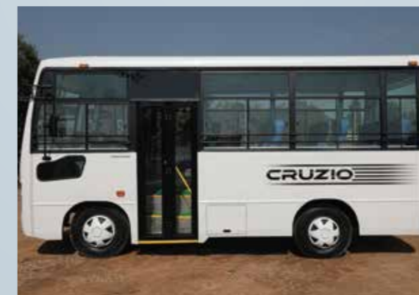
रोल्ड रूफ़ पैनल और साइड स्ट्रेच पैनल