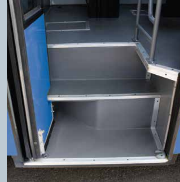
अल्युमिनियम टॉप के साथ पूरी लंबाई वाला फुटरेस्ट

हम सभी जानते हैं कि ड्राइवर और यात्रियों की सुरक्षा सबसे ज्यादा मायने रखती है । इसलिये हमने बनाई महिंद्रा CRUZIO, जो कि इस श्रेणी की एकमात्र पूरी तरह रोलओवर कम्प्लायंट बस है । हमने इसमें एक फ़ायर डिटेक्शन एंड अलार्म सिस्टम (FDAS) भी लगाया है, ताकि आप आपातकालीन स्थिति आने से पहले ही आग पर नियंत्रण कर सकें ।